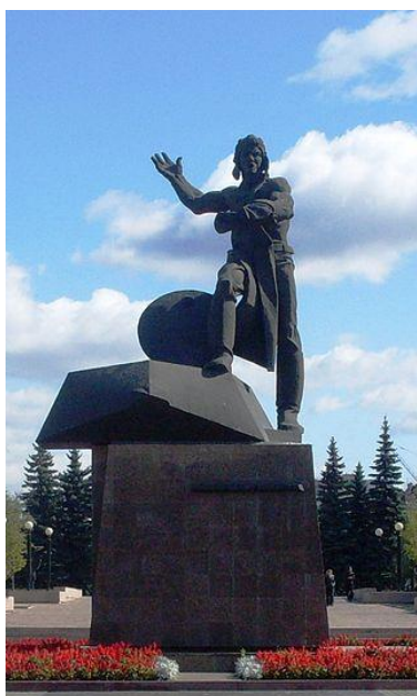
Монумент «Тыл – фронту».